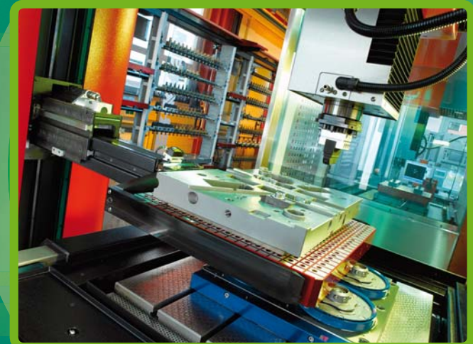
Palettenwechsel auf der Erodiermaschine

Um Einzelteile mit hoher Präzision auch wirtschaftlich und mit kurzer Durchlaufzeit herstellen zu können, haben wir in eine hochmoderne Fertigungslinie investiert. Damit sind wir in der Lage, verschiedene Arbeitsschritte, wie Fräsen, Erodieren, Waschen und Messen, automatisiert miteinander zu verbinden.